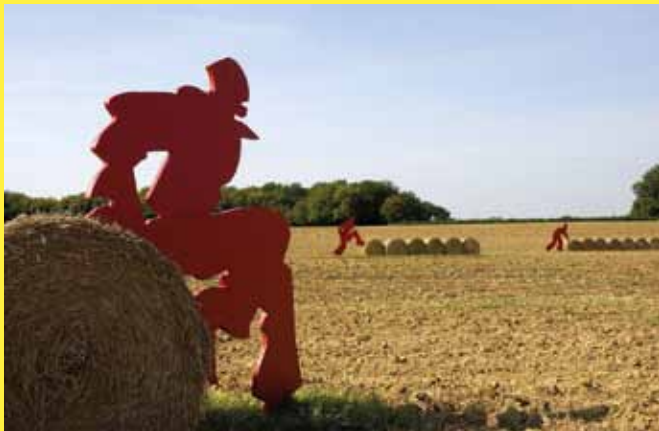
“Urban natur” par Pedro Marzorati - Cervon / agriculteur : Philippe Sauvat / 2006

Exposition également visible samedi 24 septembre.